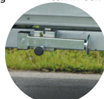
OPTIE: kantelbare steunpoten