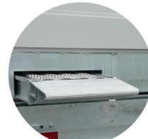
Geïntegreerde aluminium oprijplaten in een slede