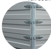
OPTIE: een of meerdere lagen opbouw