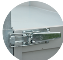
Treksluitingen en aluminium opbouw van 35cm hoog