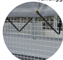
OPTIE: loofrekken OPTIE: platte bache